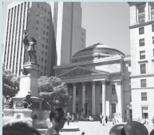
Où peut bien être Jeanne Mance sur cette photo?

Si vous devez annuler, prière d'avertir le plus tôt possible.