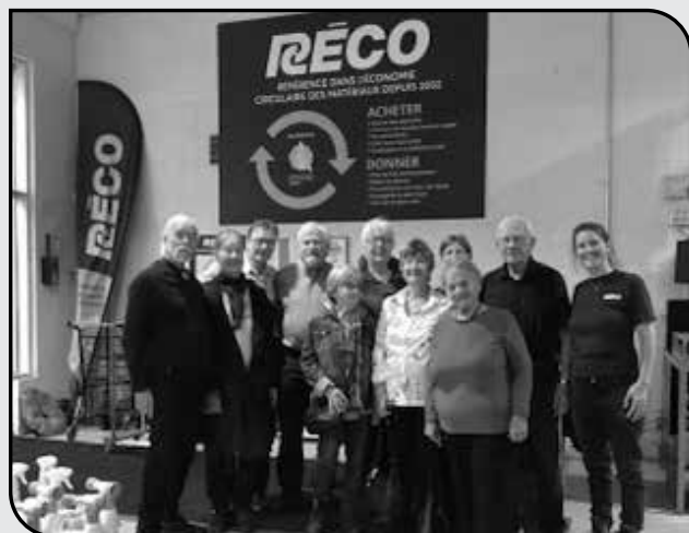
Des membres de différents secteurs chez Reco.